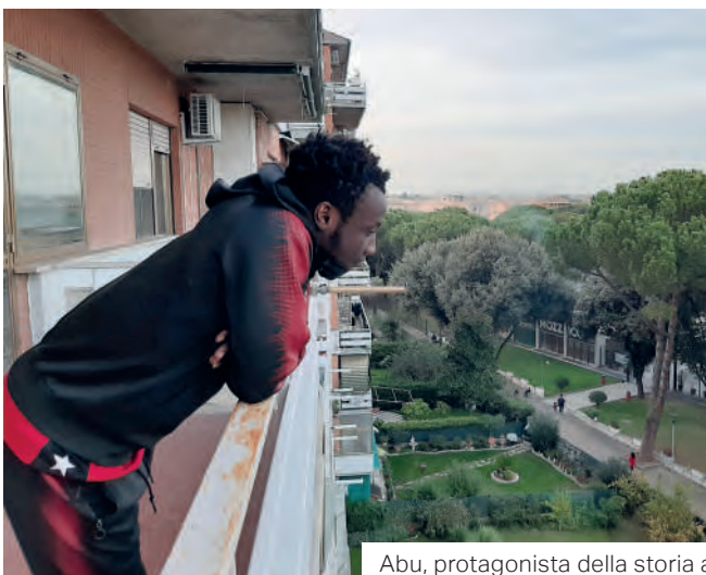
Abu, protagonista della storia a lato.

«L'immigrazione per tanto tempo è stata un'ossessione, ma non una narrazione», afferma la scrittrice Igiaba Scego. Forse adesso è arrivato il momento di ripensare l'approccio alle migrazioni per far sì che l'incontro con l'altro diventi uno spazio di guarigione e di comunione fraterna.