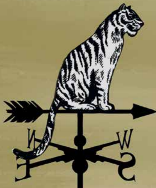
Illustrazione Douglas Augusto Fazzioni Realizzazione grafica Umberto Paciarelli

Laureata in Scienze Sociali, dopo un'esperienza ultraventennale sul campo, in Pakistan, nell'ambito educativo, nel dialogo interreligioso, nella promozione umana, oggi lavora a Genova a contatto con immigrati di prima e seconda generazione. È autrice del libro "Oltre il velo. Nel cuore del Pakistan" (2013), per la collana Vite vissute di Città Nuova.