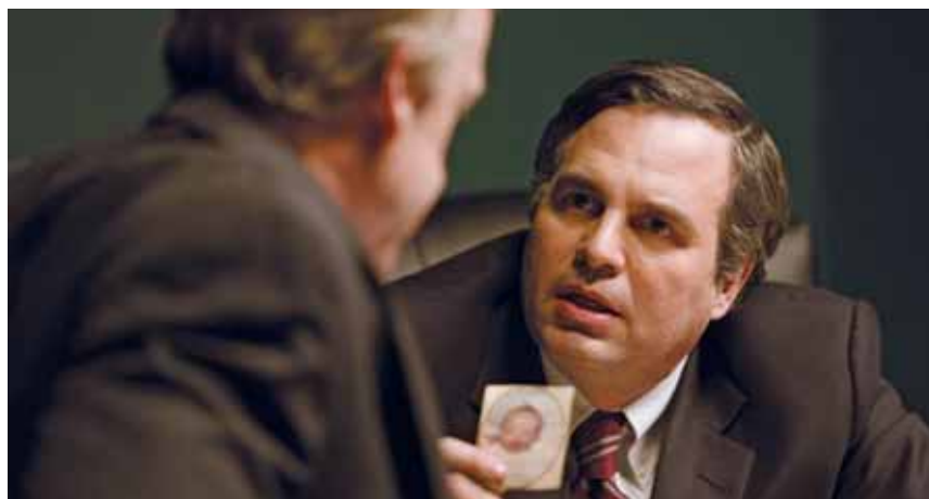
Scena da "Dark waters" ("Cattive acque"): Mark Ruffalo interpreta l'avvocato Robert Bilott nel film sul caso Usa collegato a quello italiano.

tipo i Benetton, partiti col fare i maglioni e arrivati a gestire autostrade, aeroporti, ecc. Di antico lignaggio è, invece, nell'alto vicentino, la dinastia dei Marzotto, tuttora il primo gruppo tessile italiano, che nel Comune di Trissino decise, nel 1965, di aprire la RiMar, un centro di ricerca e, poi, di produzione, destinata a utilizzare quelle sostanze sperimentate negli Usa per tanti usi, come