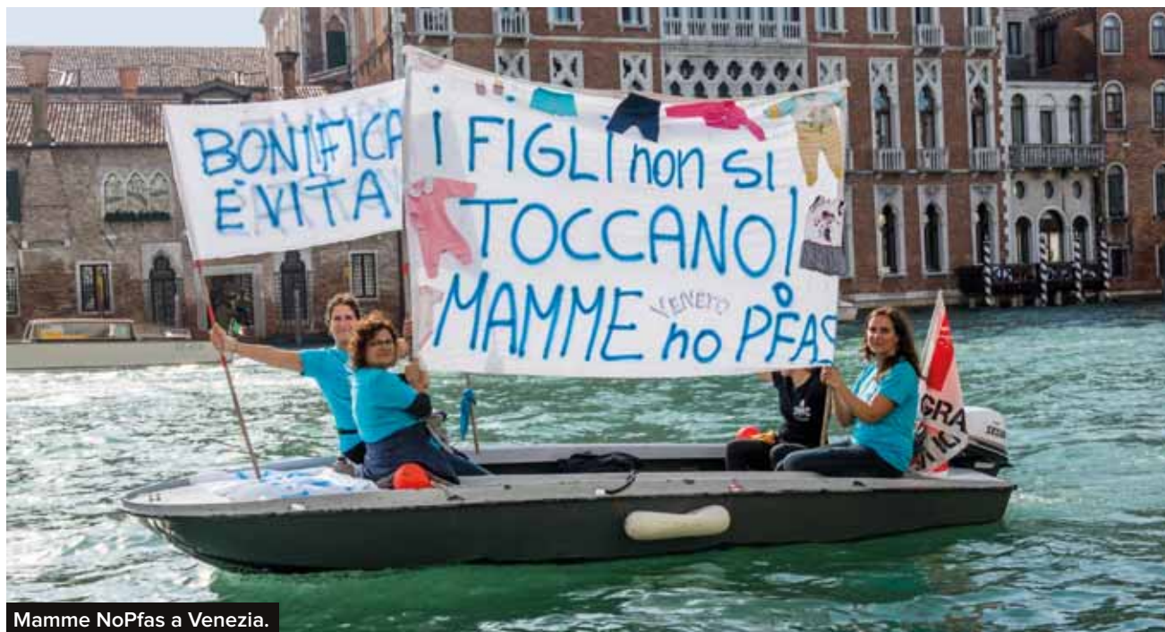
Mamme NoPfas a Venezia.