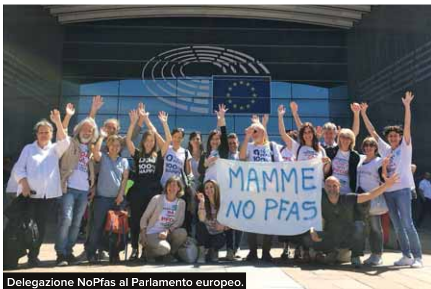
Delegazione NoPfas al Parlamento europeo.

è ormai ben nota alla comunità scientifica internazionale. Viene lanciato l’allarme alla Regione Veneto, che pone dei filtri negli acquedotti e inizia canalizzazioni da altre fonti non compromesse. Si comprende rapidamente che la causa principale del problema è la Miteni, collocata sopra una ricarica di falda acquifera, ma la Regione riconosce che le sostanze dannose «sono utilizzate anche da altre aziende». Le Ulss eseguono un piano di sorveglianza sanitaria della popolazione delle zone più colpite. Nella “zona rossa”