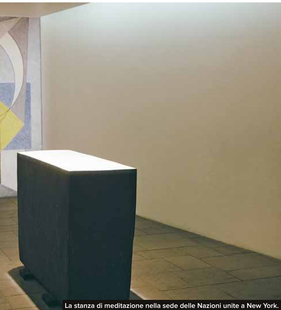
La stanza di meditazione nella sede delle Nazioni unite a New York.