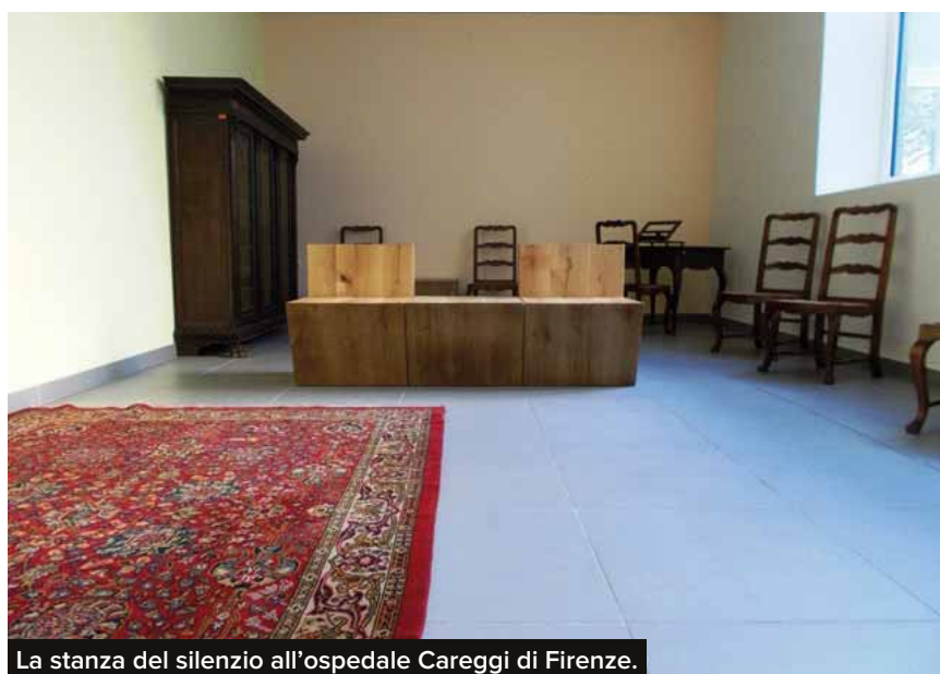
La stanza del silenzio all'ospedale Careggi di Firenze.