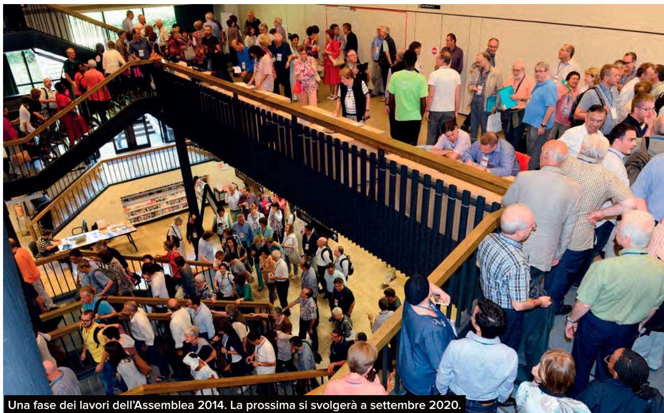
Una fase dei lavori dell'Assemblea 2014. La prossima si svolgerà a settembre 2020.

forse la più sofferente, la più disorientata. Stiamo puntando su “poli formativi” nelle cittadelle dell’Opera, sulla formazione dei formatori e sulla definizione di linee più concrete per il progetto».