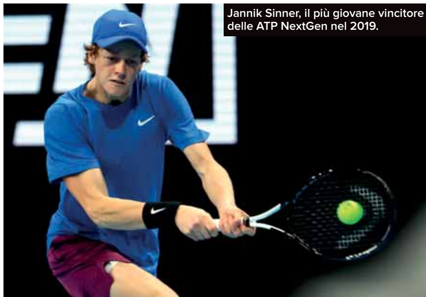
Jannik Sinner, il più giovane vincitore delle ATP NextGen nel 2019.