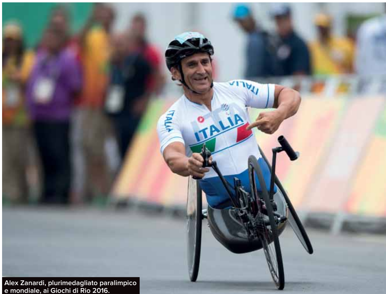
Alex Zanardi, plurimedagliato paralimpico e mondiale, ai Giochi di Rio 2016.