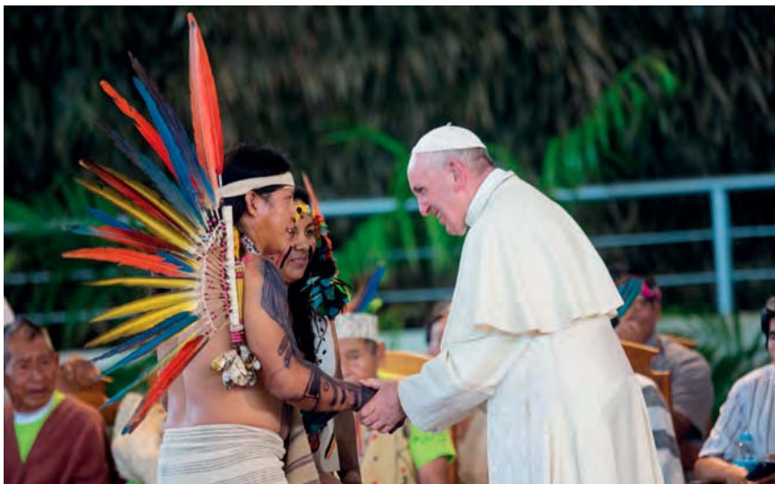
Papa Francesco a Puerto Maldonado, nel 2018, con migliaia di indigeni peruviani.

regione. E risuonano le parole del Signore a Mosè: «Togliti i sandali dai piedi, perché il luogo sul quale tu stai, è suolo santo». Quattromila rappresentanti delle diverse comunità indigene dell'Amazzonia sono riuniti al Coliseo di Puerto Maldonado per vedere papa Francesco. Lo attendono con ansia. Di lui sanno quanto basta per considerarlo un alleato nella difesa della casa comune. Anche Bergoglio