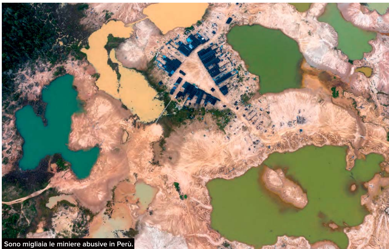
Sono migliaia le miniere abusive in Perù.