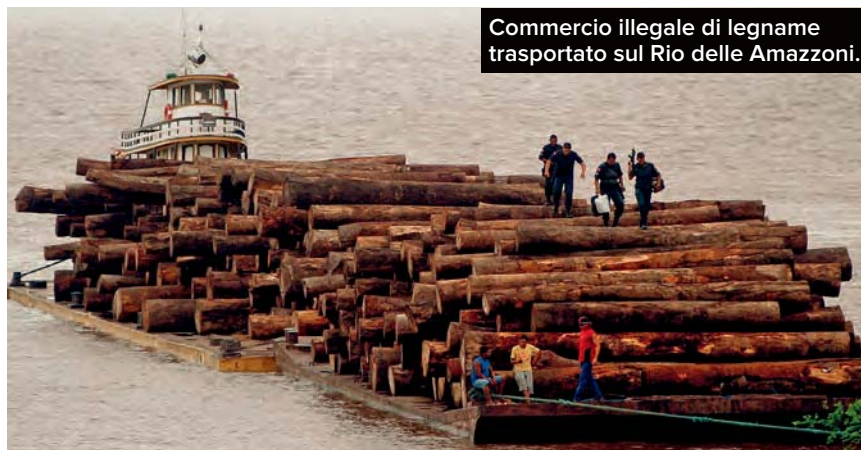
Commercio illegale di legname trasportato sul Rio delle Amazzoni.