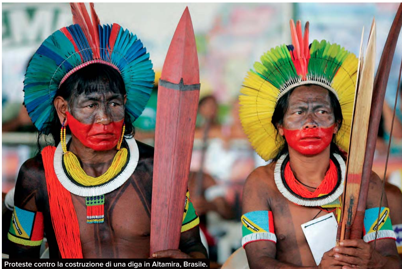
Proteste contro la costruzione di una diga in Altamira, Brasile.

con l'inganno o la violenza nei poverissimi altipiani –, vendute e comprate nel mercato del sesso a pagamento. Il grido della terra e degli esseri umani risuona all'unisono. A Madre de Dios e in centinaia e centinaia di altri punti dolenti e meravigliosi d'Amazzonia. Le frontiere dell'estrattivismo. Sistema non nuovo: fin dalle prime esplorazioni del XVI secolo, la selva è stata considerata uno spazio vuoto da sfruttare. Niente di più falso. Nella regione, risiedono 35 milioni di persone tra cui quasi tre milioni di indigeni, articolati in 390 popoli che parlano 240 lingue differenti. Sono questi ultimi, troppo spesso considerati sopravvissuti di altre epoche remote, le principali vittime di un modello che non perdona la loro alterità e rifiuto all'omologazione. Specie ora che,