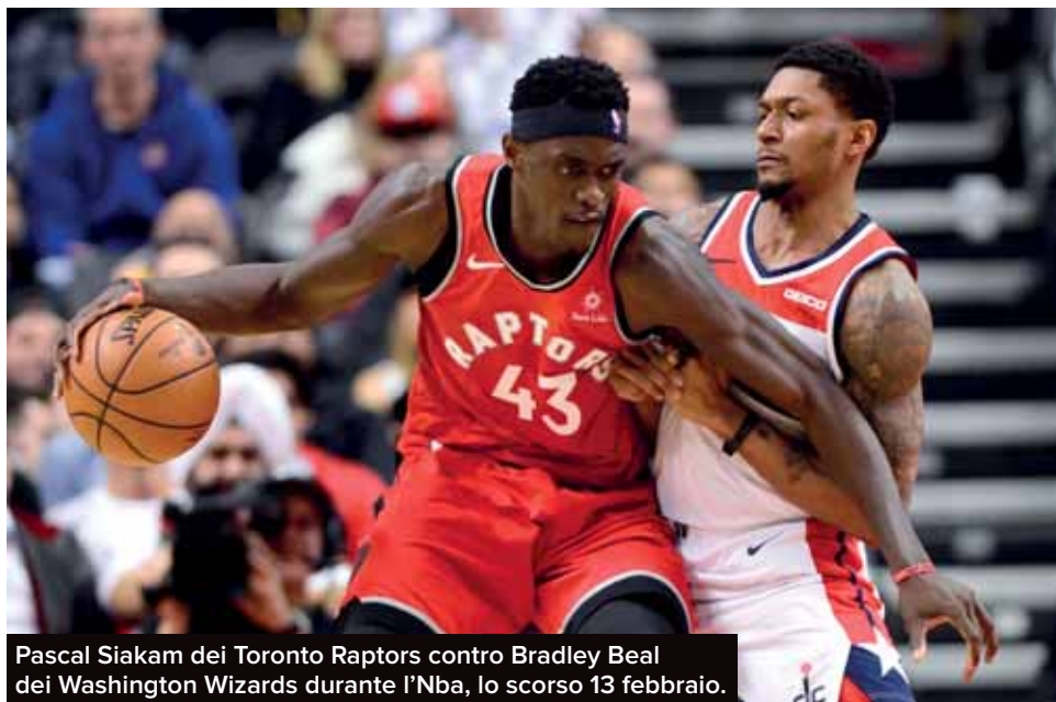
Pascal Siakam dei Toronto Raptors contro Bradley Beal dei Washington Wizards durante l'Nba, lo scorso 13 febbraio.

ma a lungo andare concentrazione e dedizione vennero meno: non faceva più tutti i compiti che gli affidavano e pensammo più volte di espellerlo, ma i suoi risultati erano così notevoli che decidemmo di dargli altre possibilità». Appare già ovvio che prepararsi ad essere prete non è la strada vocazionale giusta per Pascal, che tuttavia non vorrebbe deludere il padre. La svolta arriva quando, già all'epilogo dei suoi studi teologici, sulla strada per il mercato della sua cittadina, inviato a comprare del platano per la famiglia, Pascal s'incanta davanti a una sontuosa villa, sognando una vita agiata e non più povera. La tenuta appartiene alla famiglia di Luc Mbah, giocatore nel 2011 dei Milwaukee Bucks e organizzatore