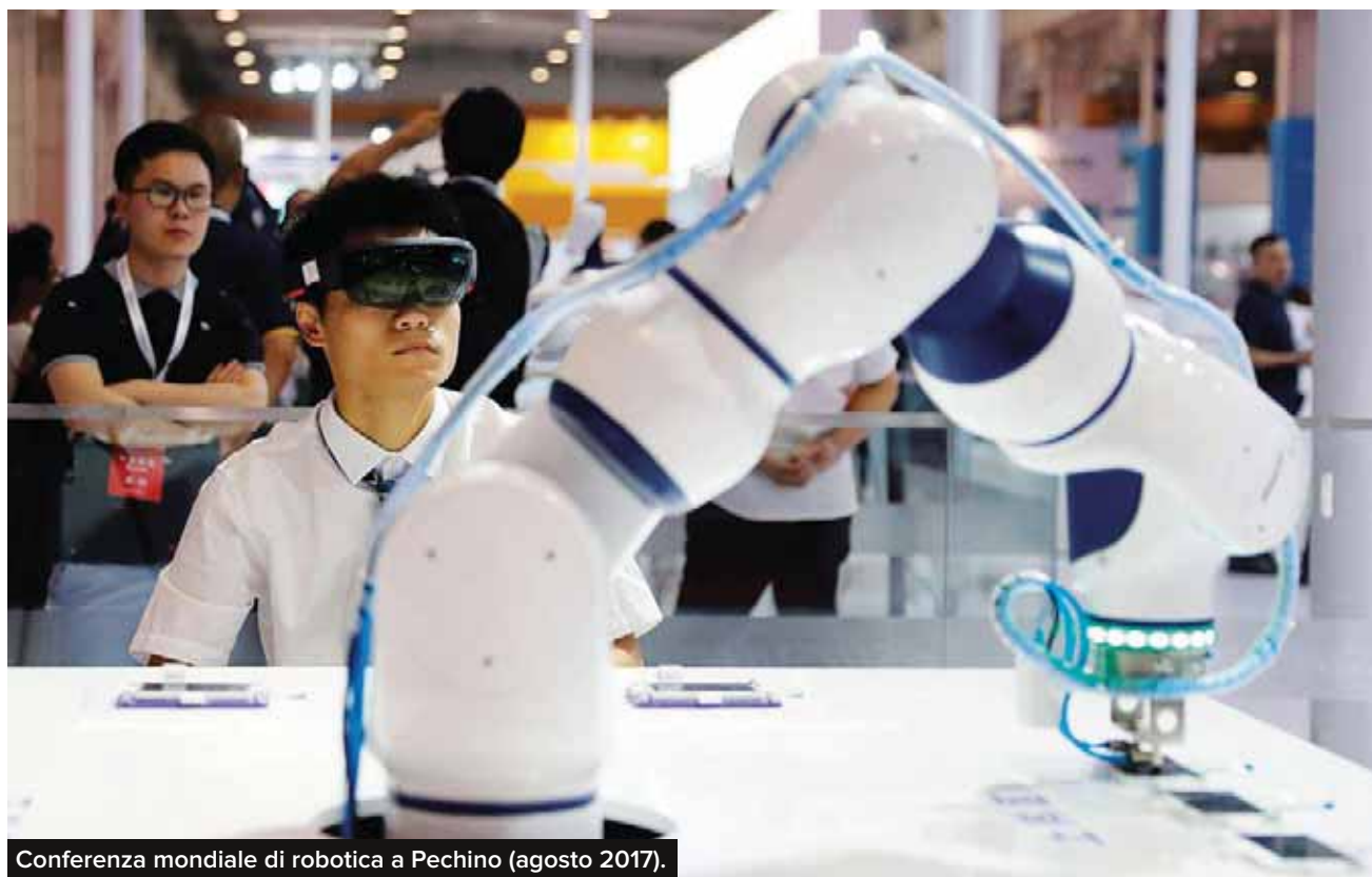
Conferenza mondiale di robotica a Pechino (agosto 2017).