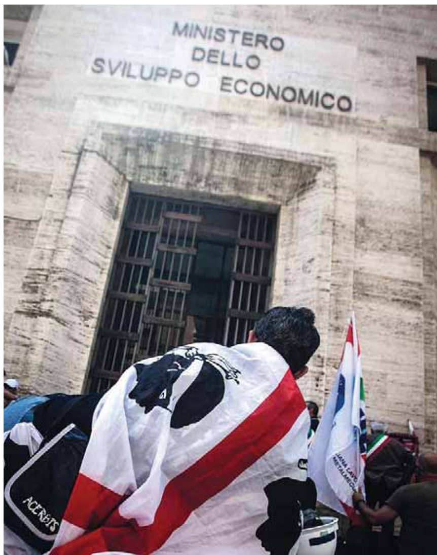
Protesta davanti alla sede del Mise che ha promosso il piano Industria 4.0 ma deve gestire 162 tavoli di crisi, a cominciare dall'Ilva dove i franco-indiani di Acelor Mittal, assieme al gruppo Marcegaglia, prevedono da 4 a 6 mila esuberanti.