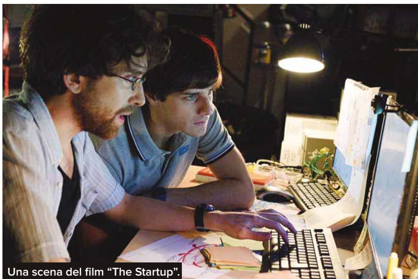
Una scena del film "The Startup".

«Il successo – diceva Winston Churchill – è l'abilità di passare da un fallimento all'altro senza perdere l'entusiasmo». Le start up, le nuove imprese, sono l'ambito dove coltivare il sogno della creatività, dell'intelligenza, delle nuove possibilità. Per loro definizione sono sperimentali, destinate al successo o al fallimento. Sono laboratori, dove testare nuovi prodotti, vagliare gli appetiti dei mercati, verifica-