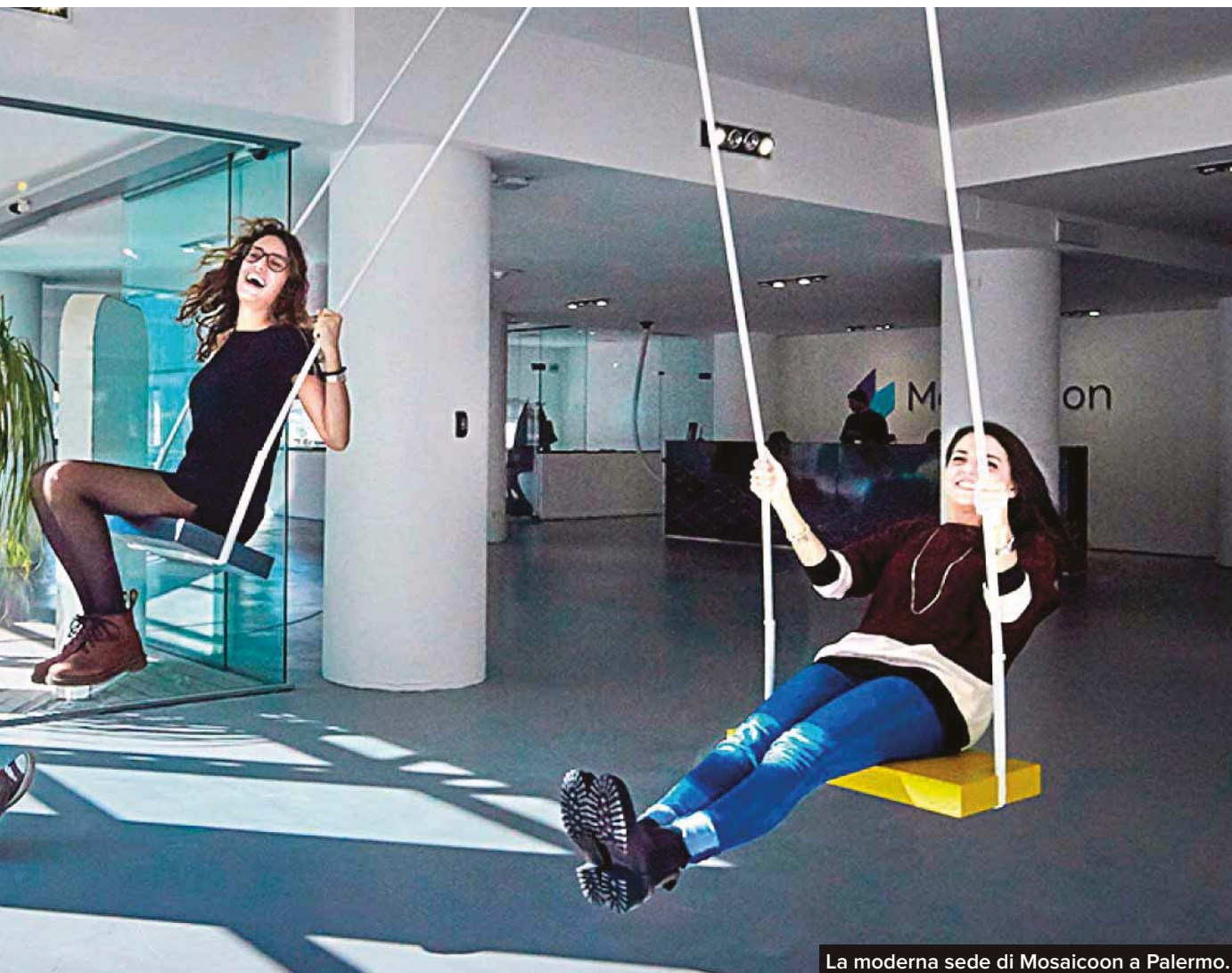
La moderna sede di Mosaicoon a Palermo.

cumulatisi negli anni che vagano fuori controllo intorno alla Terra. E così via.