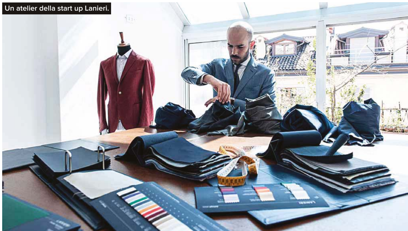
Un atelier della start up Lanieri.

In utile è il 43% delle startup innovative, per un giro di affari al di sotto di 590 milioni di euro. E in crescita gli occupati, +44,8% in un anno per un totale di 34.791 tra soci e dipendenti. La regione con la più elevata incidenza in rapporto al totale delle società di capitali è il Trentino-Alto Adige dove oltre 10 società di capitali su 1000 sono