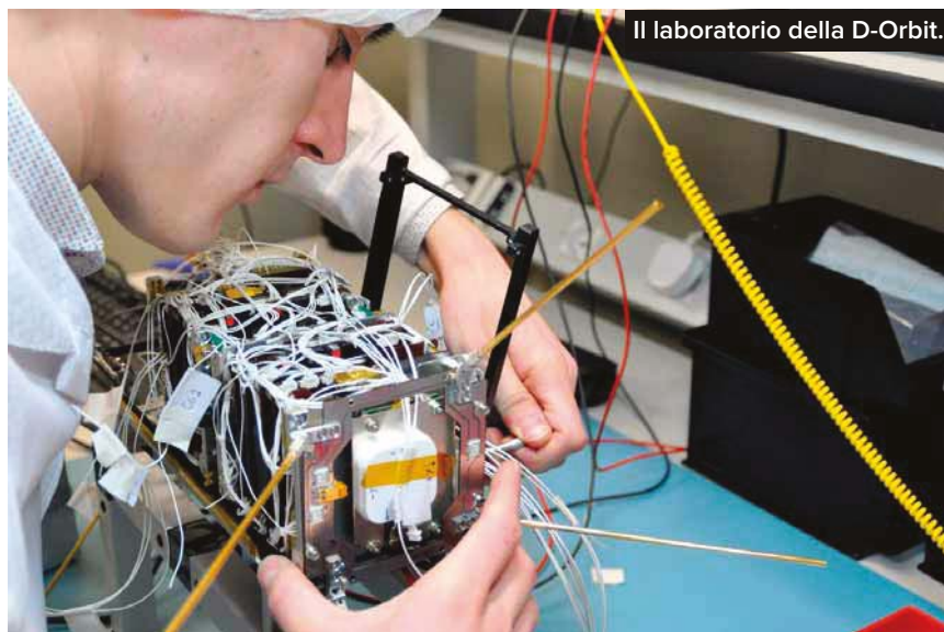
Il laboratorio della D-Orbit.

Gli ultimi dati utili, di fine dicembre 2016, forniti dal ministero dello Sviluppo economico ci dicono che il numero di start up innovative iscritte alla sezione speciale del Registro delle imprese sono 6.745, un trend demografico decisamente positivo che segna un +31 per cento in un anno e +112 per cento in due anni. Il tasso di mortalità appare ancora notevolmente basso, mentre il tasso di sopravvivenza delle imprese è molto alto: nel 95,1% dei casi risultano ancora attive a tre anni dall'avvio.