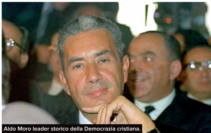
Aldo Moro leader storico della Democrazia cristiana.