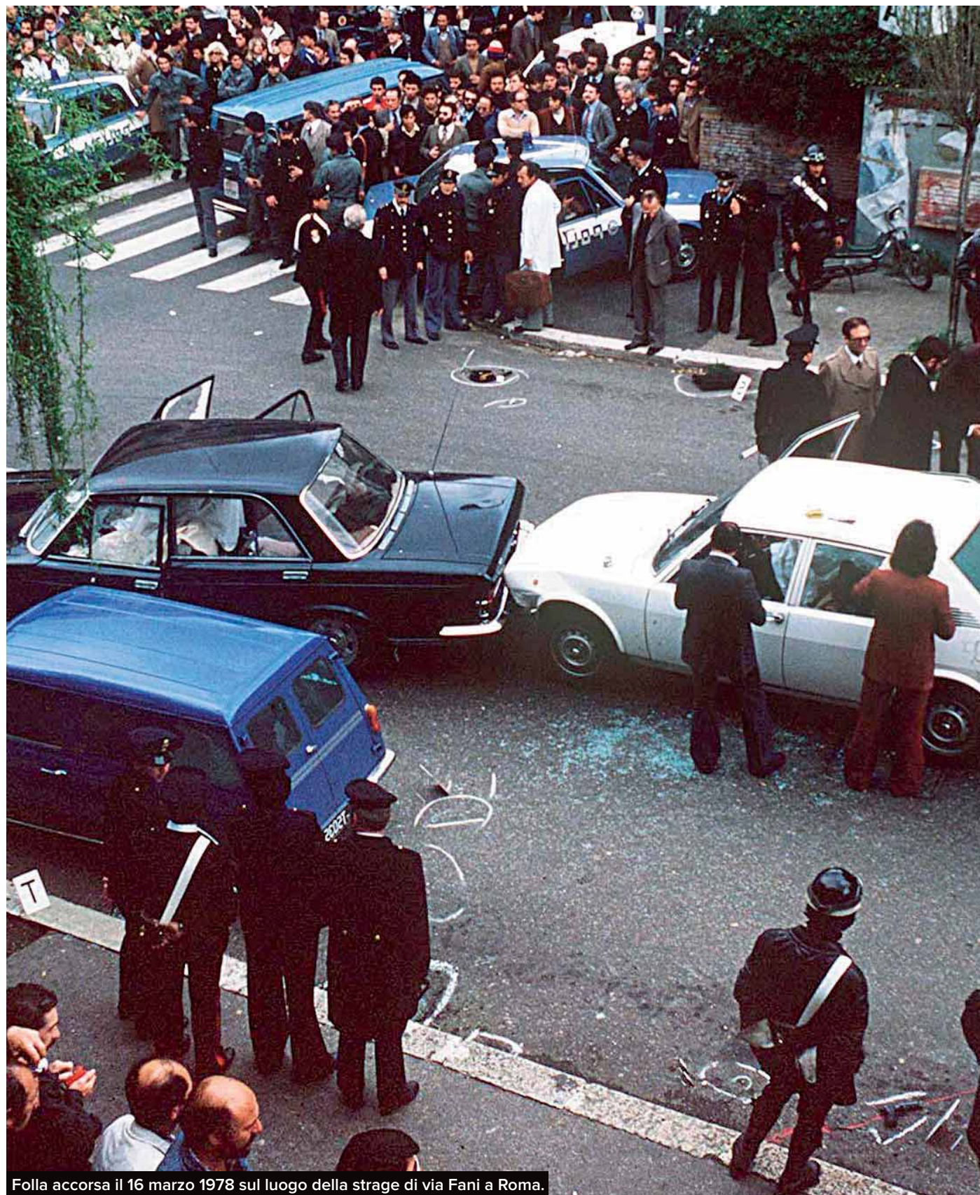
Folla accorsa il 16 marzo 1978 sul luogo della strage di via Fani a Roma.