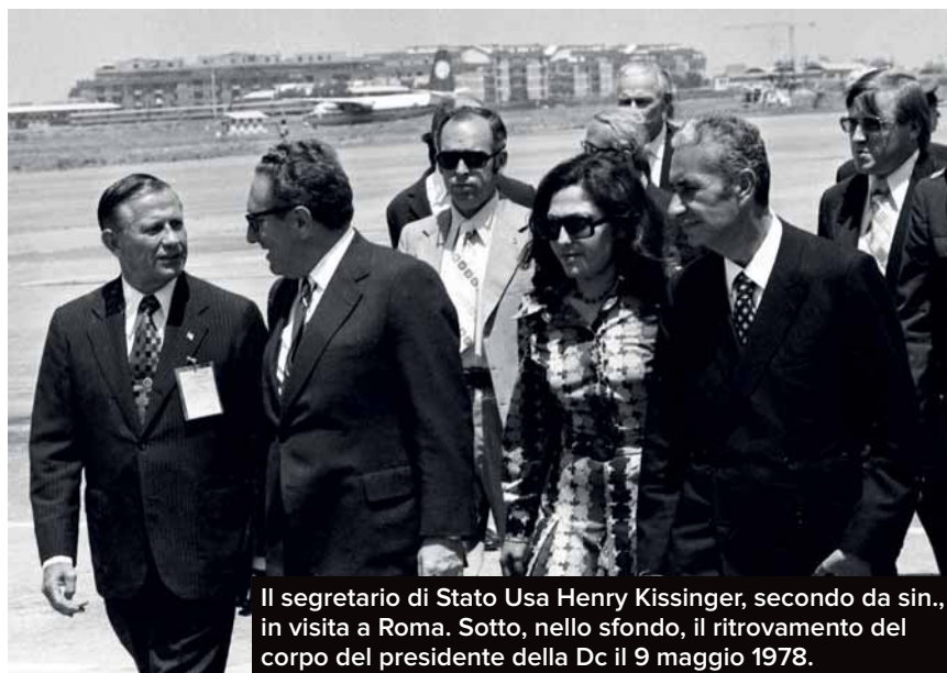
Il segretario di Stato Usa Henry Kissinger, secondo da sin., in visita a Roma. Sotto, nello sfondo, il ritrovamento del corpo del presidente della Dc il 9 maggio 1978.