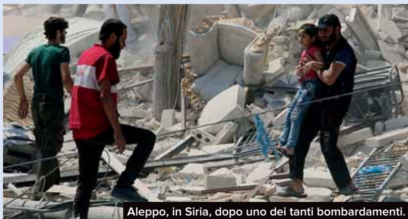
Aleppo, in Siria, dopo uno dei tanti bombardamenti.