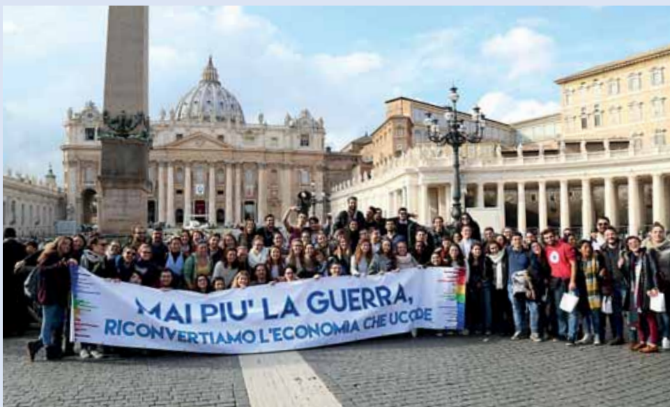
Una rappresentanza del Movimento dei Focolari in piazza San Pietro il 20 novembre 2016.

Blog del gruppo di lavoro economia disarmata economydisarmata1.blogspot.it economia.disarmata@gmail.com bankmob@focolare.org