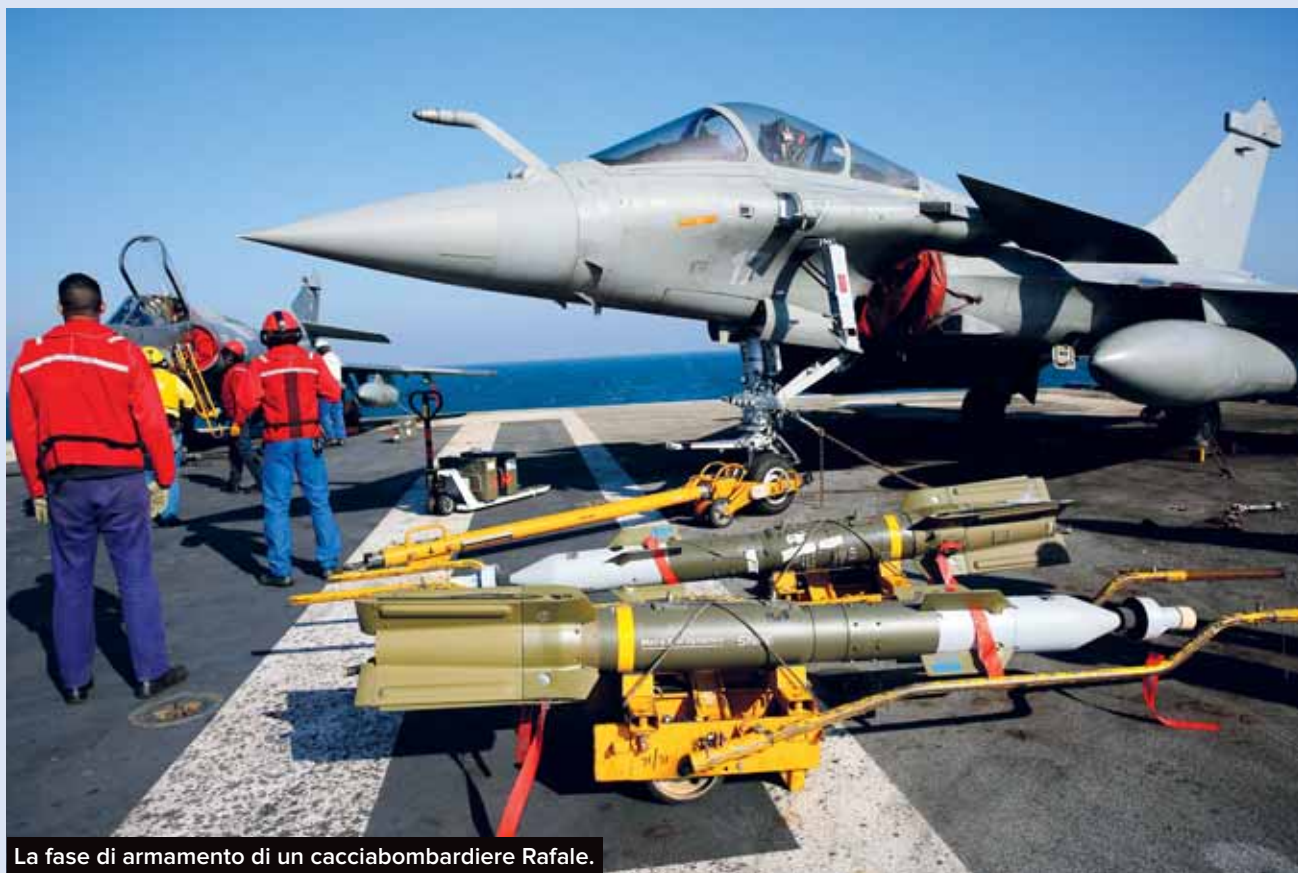
La fase di armamento di un cacciabombardiere Rafale.

TAPPE DI UN PERCORSO NELLA SOCIETÀ ITALIANA A PARTIRE DALLA RICERCA DELLA PACE E RIPUDIO DELLA GUERRA. LA POSIZIONE DEL MOVIMENTO DEI FOCOLARI