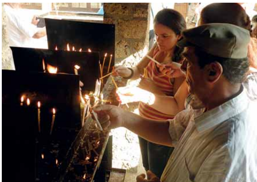
Piazza Makedonija, al centro della capitale Skopje. Sopra: nel monastero di Sant Naum. Sotto: la statua del memoriale di Madre Teresa, nata a Skopje. A fronte: conversazione al bar nel centro di Struga.

dopo il conflitto del 2001, quando la minoranza albanese insorse reclamando una maggiore partecipazione nell'amministrazione e un riconoscimento reale della propria etnia, cultura e lingua. Gli scontri durarono solo alcuni mesi e il Trattato di Ohrid mise fine a una situazione che poteva degenerare in un conflitto altrettanto violento e sanguinoso come quello di altre parti dei Balcani.