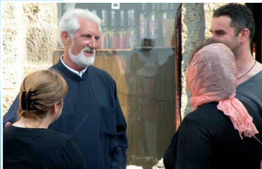
Uno dei padri ortodossi parla con alcuni fedeli del monastero di Sant Naum, nei pressi di Ohrid. Sotto: nella moschea di Tetovo. Foto grande: chiesa di San Giovanni a Kaneo sul lago di Ohrid.