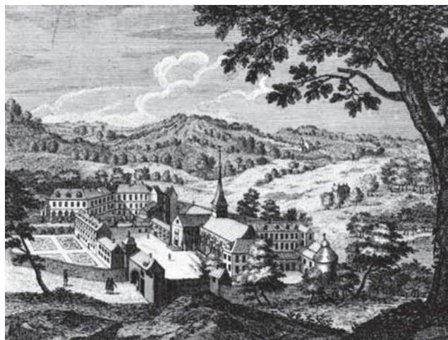
L'abbazia di Port Royal nel XVI secolo, prima della sua distruzione ad opera di Luigi XIV. Sotto: la cittadina francese di Clermont-Ferrand, dove nacque Pascal (a fronte).

A 350 anni dalla morte, Pascal è oggetto di celebrazioni e dibattiti, citato a conferma o a demolizione di riflessioni di varia natura. In questo, è un personaggio del tutto simile ad altri “grandi” che continuano, con le loro idee, a nutrire le intelligenze. Ma al cuore del suo percorso di vita, vi è la presa di coscienza che Dio «non si trova che per le vie insegnate nel Vangelo». È lì la possibilità di un incontro con il Dio vivo. In questo è testimone di come il succo della vita non si trovi in cose grandi, di cui solo pochi sono capaci. È invece in un quotidiano, anonimo, ordinarissimo camminare «per le vie insegnate nel Vangelo» che la vita ci aspetta. È lì che siamo davvero vivi. Ed è in questa ordinarietà, che la vera grandezza di Pascal si fa pienamente manifesta. ■