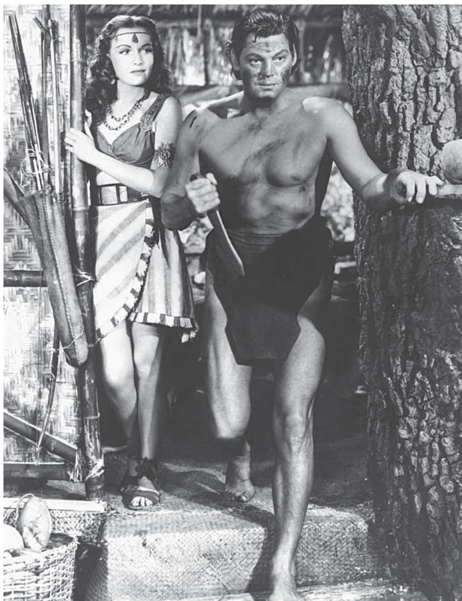
L'atleta-attore Johnny Weissmuller, "Tarzan storico" del cinema. A fronte: una delle celebri tavole di Burne Hogarth, ora riproposte nel volume "Tarzan. Racconti della giungla" (Donzelli).

na da una nave ammutinata e morti in circostanze tragiche. Unico superstite il neonato, salvato da una scimmia che ha perso il figlio e cresciuto in un branco di gorilla come uno di loro. Col nome di Tarzan, ovvero "Pelle bianca"