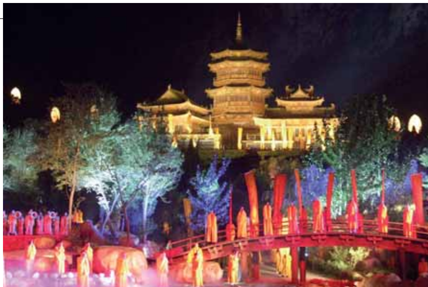
Due scene di "combattimento" kung fu e il monastero Shaolin. Questo il mondo del "pugilato della giovane foresta".

In una caverna adiacente al tempio, Bodhidharma si dedicò per nove anni alla meditazione, rivolto verso una parete. Per tenere in esercizio i muscoli e difendersi dagli animali selvaggi, imitò i portamenti e le mosse di uccelli, scimmie, cervi, creando così un codice di autodifesa.