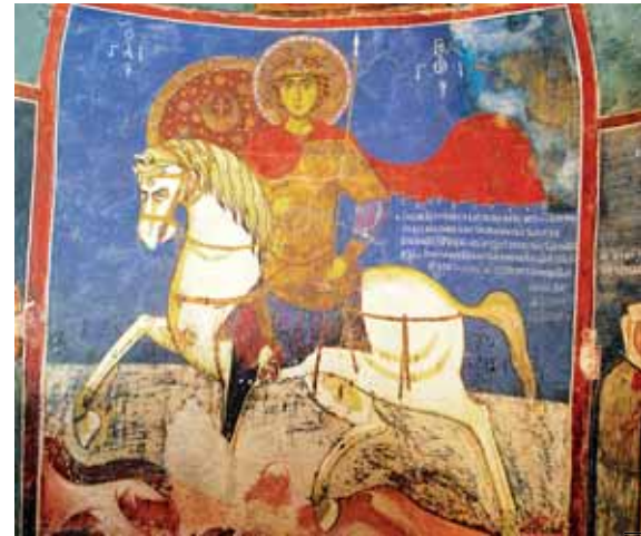
Affreschi del XII e XIII secolo nella cappella di Asinou, dedicata a Nostra Signora dei pastori.

centinaia, antiche o più recenti, affrescate o candide, in rovina o restaurate. Tra queste l'Unesco ne ha scelte una decina, inserendole nell'elenco dei siti "patrimonio dell'umanità". Me le sono cercate, ad una ad una.