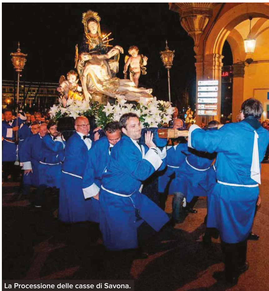
La Processione delle casse di Savona.