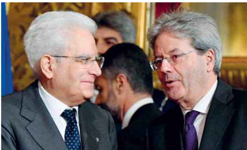
Il presidente della Repubblica Sergio Mattarella e il nuovo premier Paolo Gentiloni.

L'eco del referendum si sentirà ancora a lungo, fino alle elezioni politiche che per vie naturali dovrebbero tenersi fra poco più di un anno; la legislatura infatti termina a marzo 2018, ma nessuno esclude lo scioglimento anticipato, a causa del logoramento politico e della sconfitta referendaria. Anzi, non pochi avrebbero voluto le elezioni subito, come esito del voto, ma il capo dello Stato si è trovato vincolato al proseguimento della legislatura dalla contraddittorietà delle leggi elettorali vigenti per l'elezione della Camera dei deputati (l' Italicum , fortemente maggioritaria) e del Senato della Repubblica (proporzionale