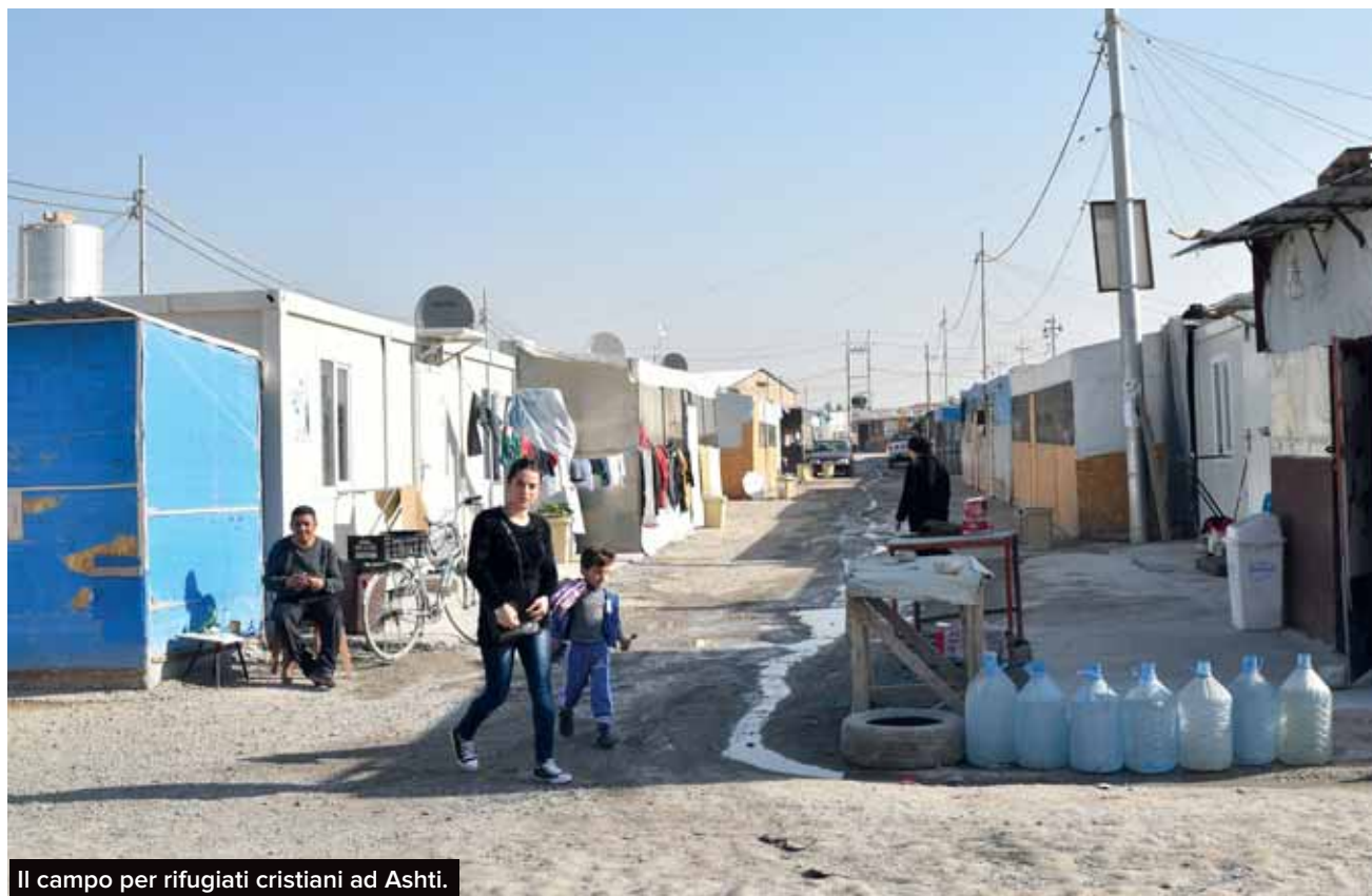
Il campo per rifugiati cristiani ad Ashti.

vede? Mi è stato donato da un medico musulmano di Erbil, a cui ero ricorso per i miei mali».