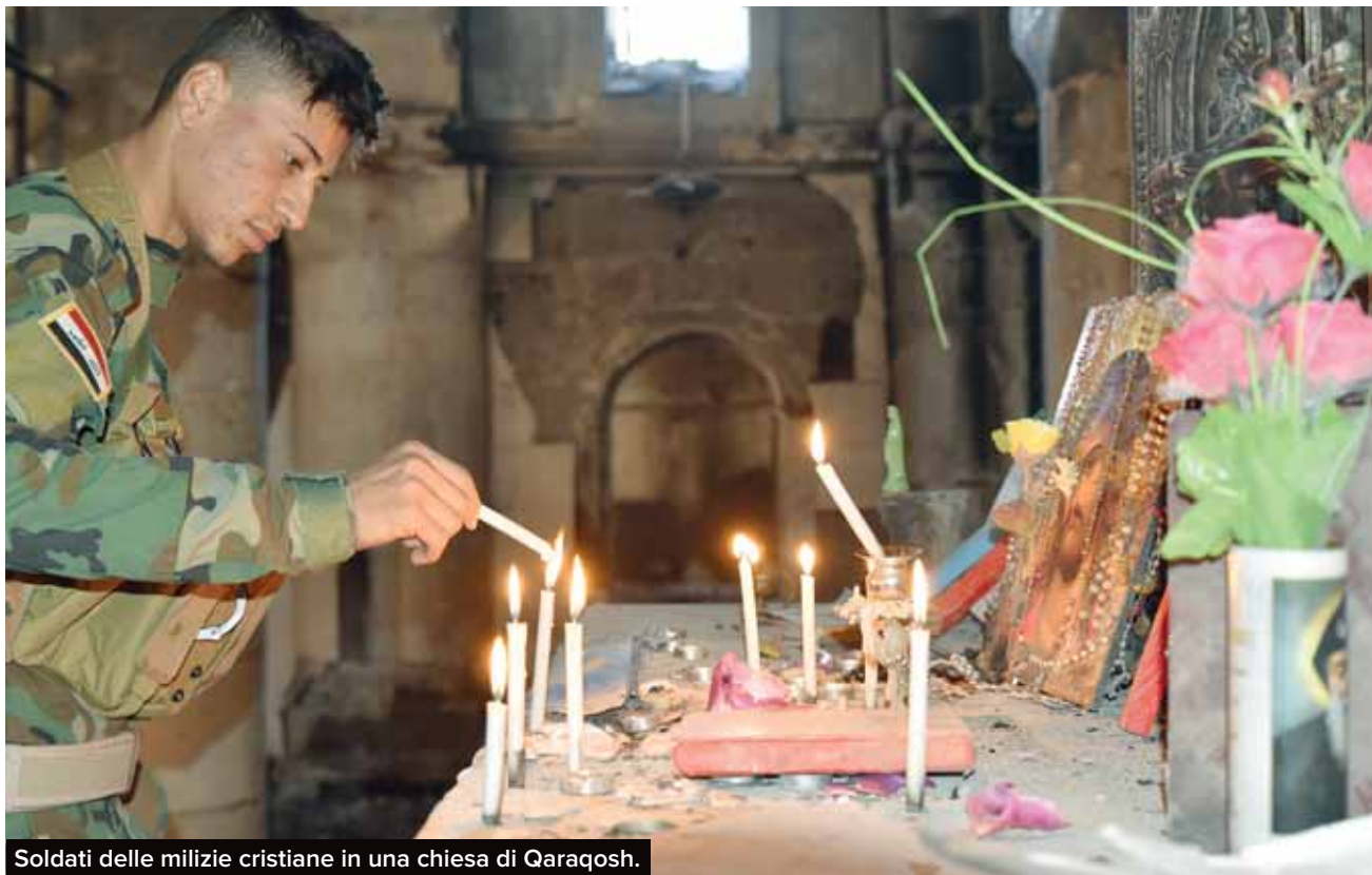
Soldati delle milizie cristiane in una chiesa di Qaraqosh.

cinano e accendono i loro ceri, le lacrime agli occhi. Il cortile: il lato orientale è stato usato come tiro a segno. Le colonne sono scarnificate, come avevo visto a Srebrenica, nelle case dei musulmani saccheggiate dai cristiani serbi: la guerra imbestialisce. Punto e basta. Nella chiesa antica scorgo un Cristo più grande che regge quel che resta di un Cristo più piccolo, che a sua