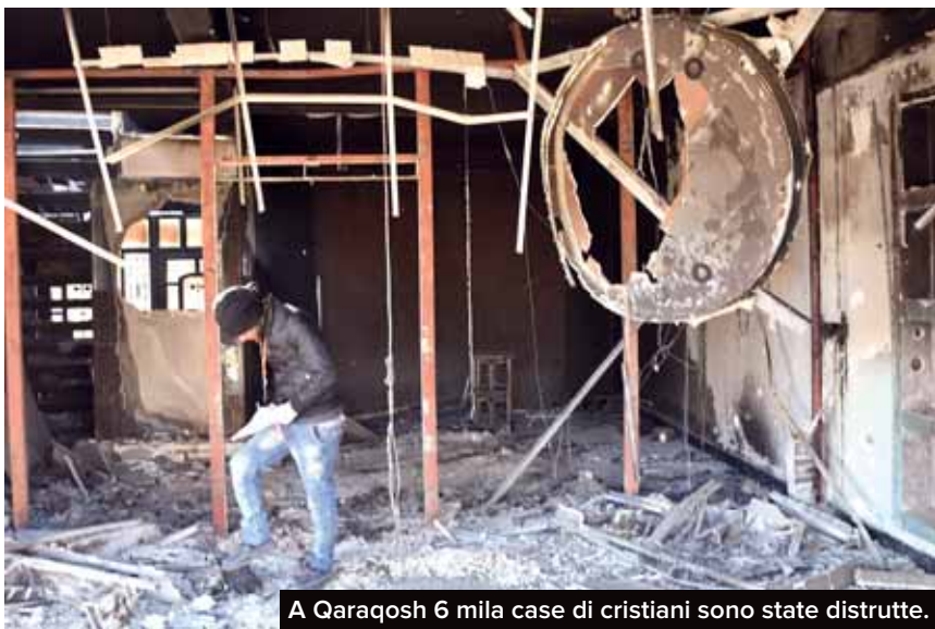
A Qaraqosh 6 mila case di cristiani sono state distrutte.

armi: venivano mischiati composti chimici per missili e proiettili. Ci sono ancora misurini, bacinelle, bossoli, bilance, una radiografia bucata per creare la scritta "Isis" poi dipinta a spray sulle armi.